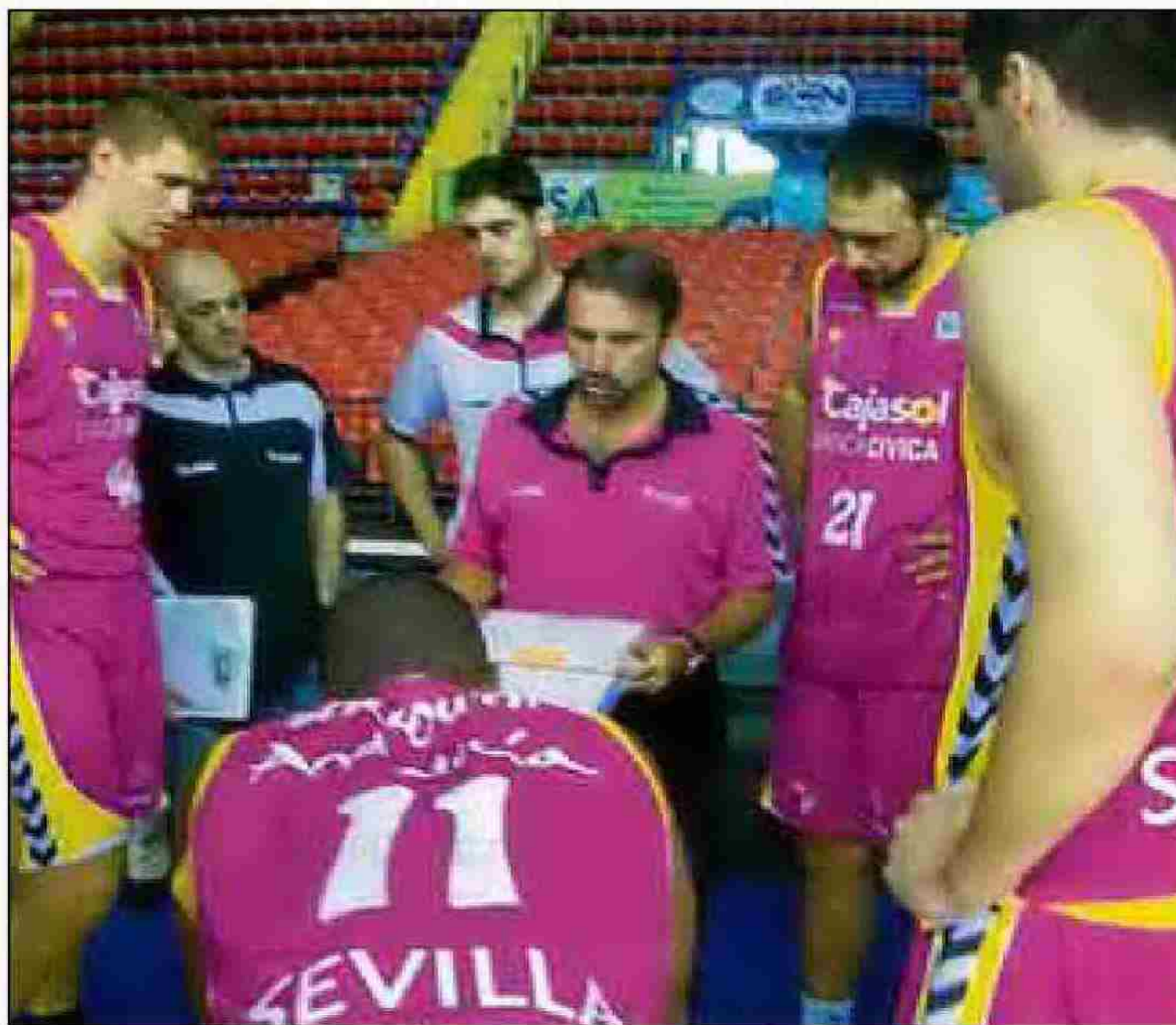
Con el nuevo amistoso, el Cajasol intenta llegar a punto a la Liga.